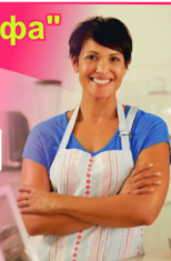
График работы - 3/3, с 07.30 до 19.00 Оплата - 1 300 руб. в день Соц.пакет. Бесплатное питание. Тел. 8-917-800-11-28 ул.Менделеева, 7/3 (ост.тр-та "Аптека")