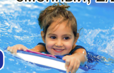
График работы - сменный, З/п: оклад + премии